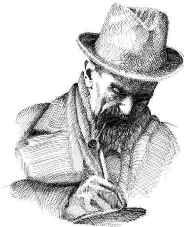
Errico Malatesta (1853 - 1932).

Le anarchiche e gli anarchici che, comprendendo l'ambiente nel quale agiscono, vogliono risvegliare lo spirito di rinnovamento nel popolo dovranno, a mio avviso, dimostrare con la diffusione delle idee e nelle varie situazioni di lotta una banale verità: che la forza dell'amore e della solidarietà, della giustezza di un mondo di liberi ed uguali è, oltre che possibile, irrinunciabile.