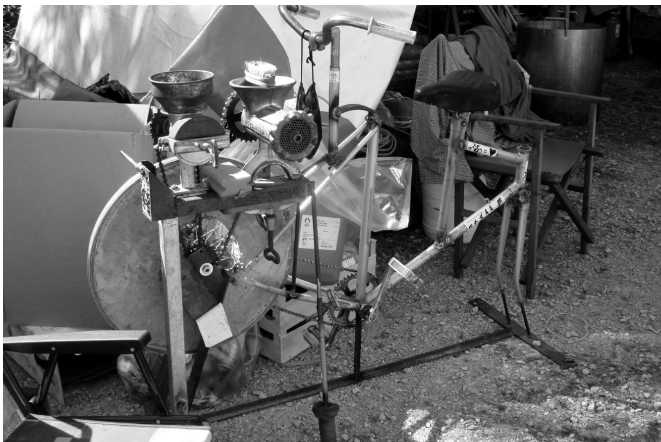
Una macchina macina-cereali a pedali, St-Imier agosto 2012.