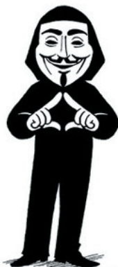
TORNIAMO IN TEMA